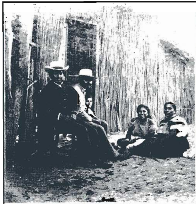
Historia 1890. "Escena de Calle"