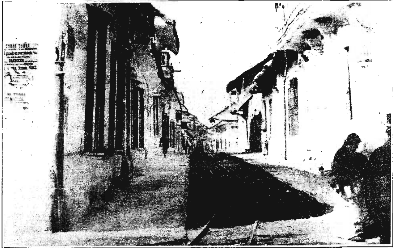
Piura al final del siglo XIX, se denomina la exposición que presentará la Alianza Francesa con las fotografías recopiladas por Anne Marie Hocquenguen.

La sala de exposición de la Alianza Francesa de Piura estará abierta al público piurano hasta el viernes 30 de los corrientes en horario de 09.00 a.m. - 01.00 p.m. y de 04.00 p.m. - 08.00 p.m.