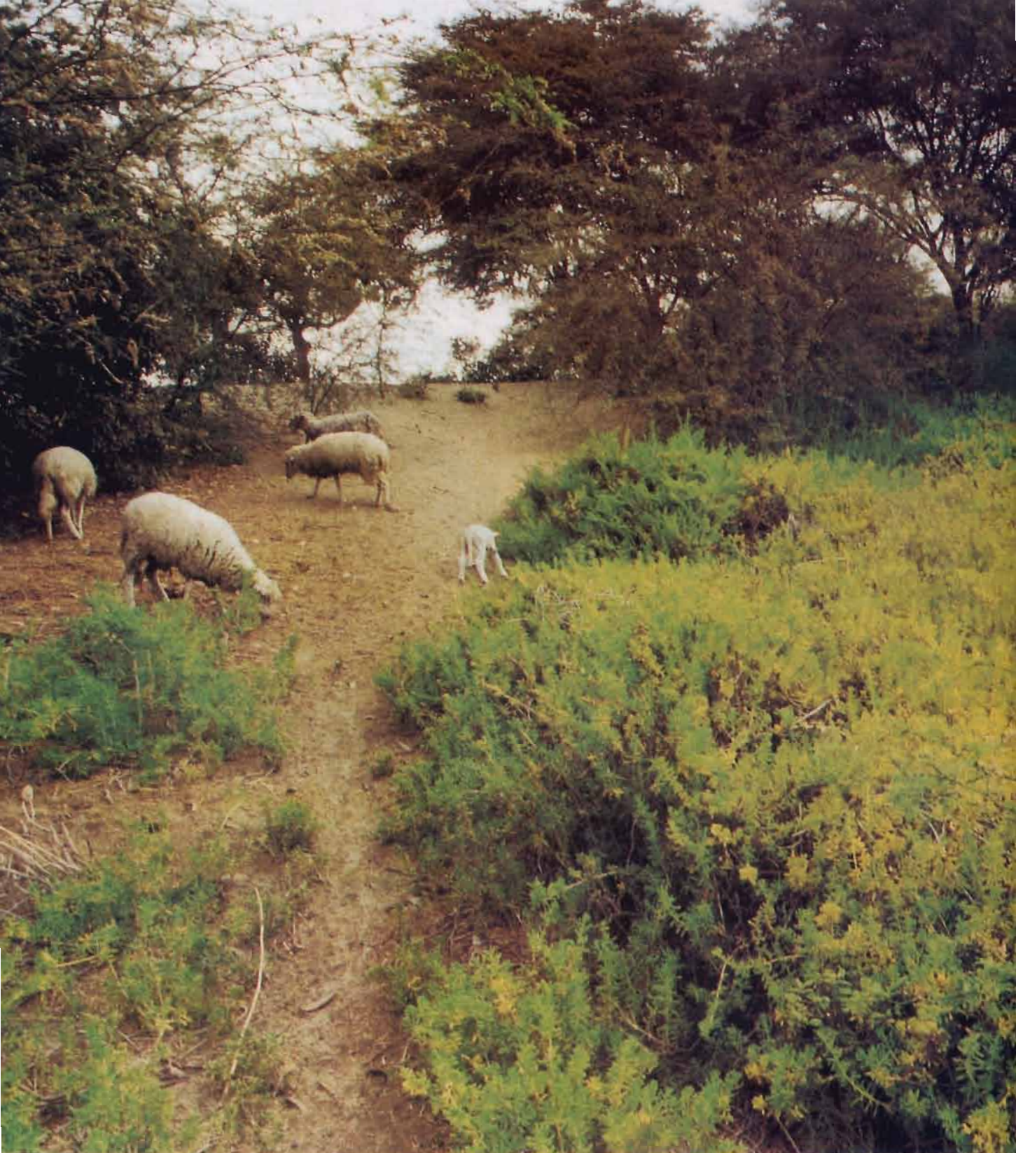
En medio del desierto, en el parque ecológico "Kurt Beer", ovejas en herbívoro trance. Las inundaciones por efecto de E