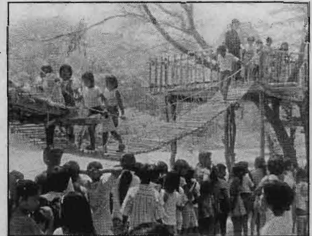
Torre de observación y puente colgante para los niños.