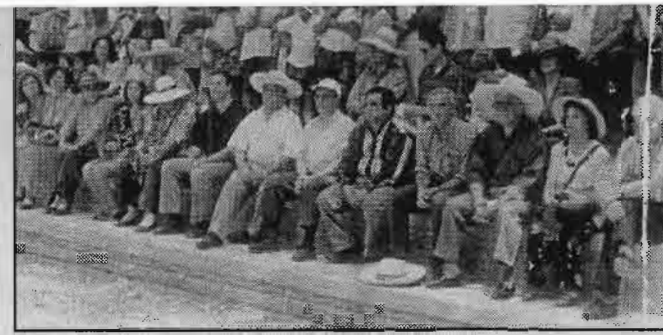
Embajadores en pleno en el Parque Kurt Beer.