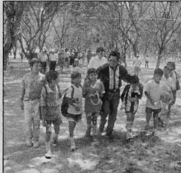
Grupos de niños acompañados del Alcalde Pepe Aguilar.

Tal como explicó Aguilar Santisteban, el Parque Kurt Beer debe fomentar la integración de la familia. Por eso es que se la ha dotado de juegos recreativos en donde grandes y chicos puedan disfrutar de momentos agradables juntos. De igual modo se busca crear conciencia ecológica y conservacionista en todos los ciudadanos.(JMGC)