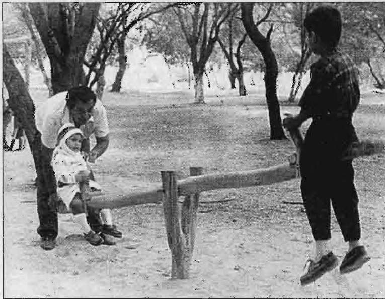
Recreo. Niños de diferentes edades, usan el parque ecológico como centro recreacional.

Beer de donar estos terrenos a Piura, acaba de aprobar un financiamiento de 46 mil dólares, que servirá para el proyecto de implementación del albergue, mobiliario, equipos de oficina, computadoras, impresoras, material para video.