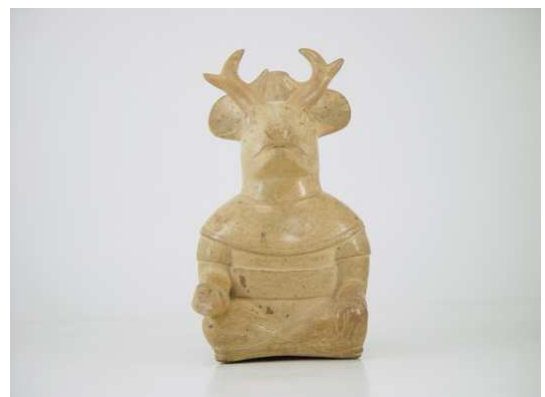
Personnage anthropomorphe assis